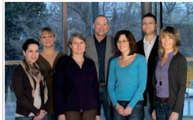
Die Mitarbeiterinnen und Mitarbeiter im Servicebereich