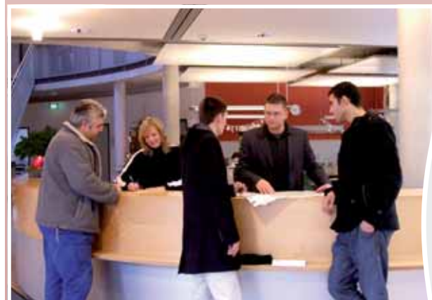
Die Info- und Servicetheke